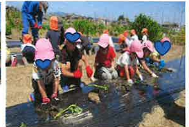
3回目だから大胆に上手に植えられる！