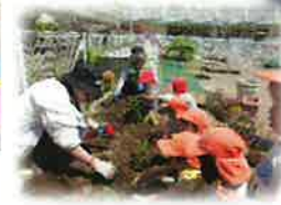
お家の方もお手伝いして頂きました