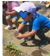
最後にお水をたっぷり♪