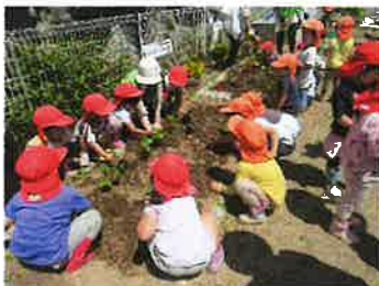
園内には野菜の苗を植えました！クッキングが楽しみ♪