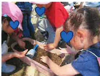
年長はトマトの種をまいたよー